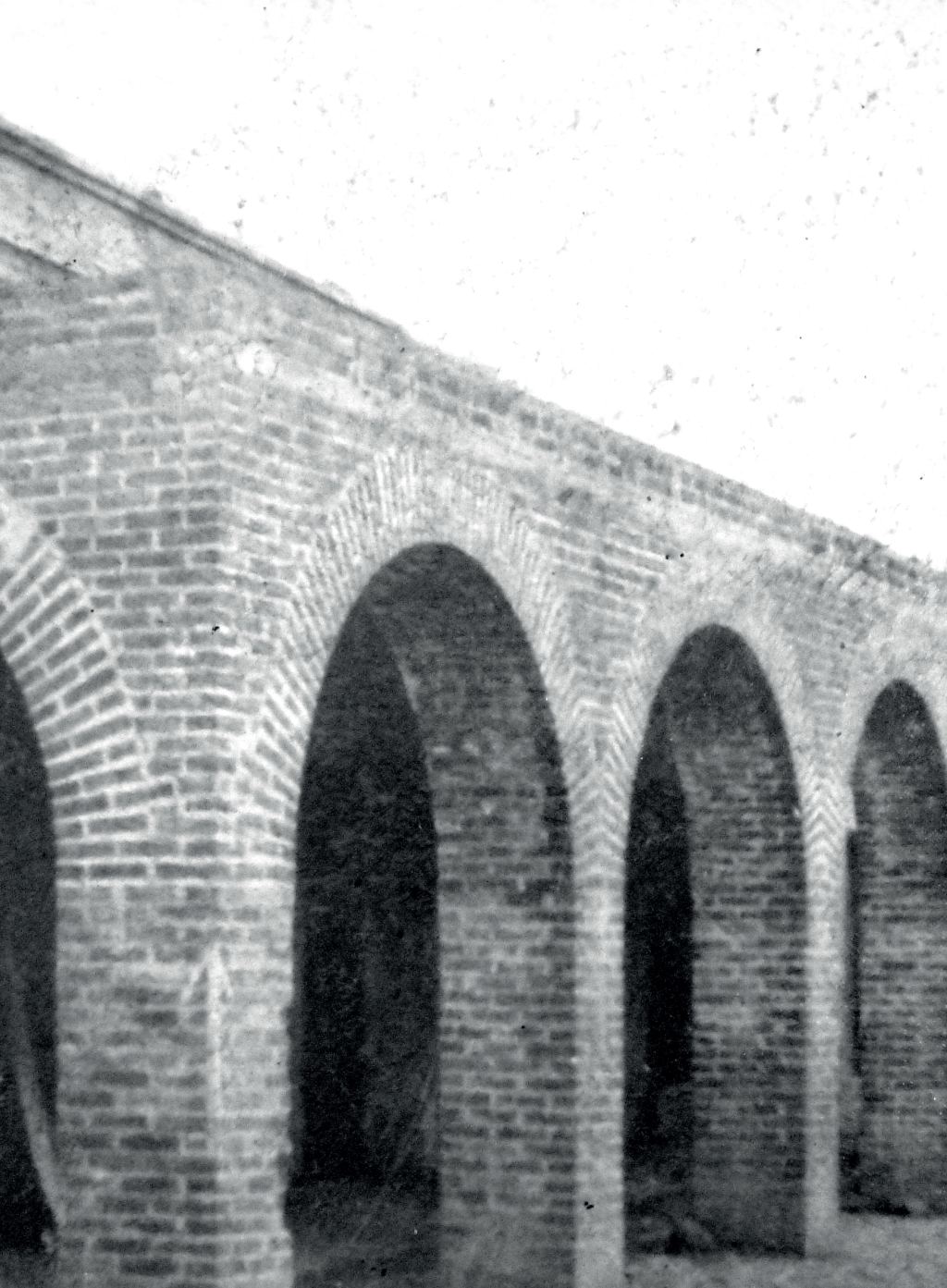
Portales centro municipal siglo XIX