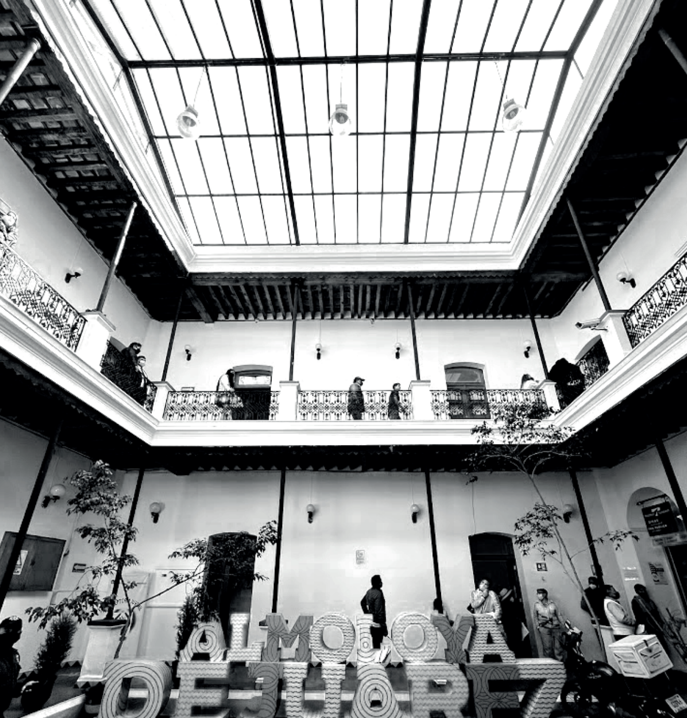
Patio central del Palacio Municipal 2022

Los entregables se recibirán en el Patio Central del Palacio Municipal en la fecha y hora establecida con anterioridad.