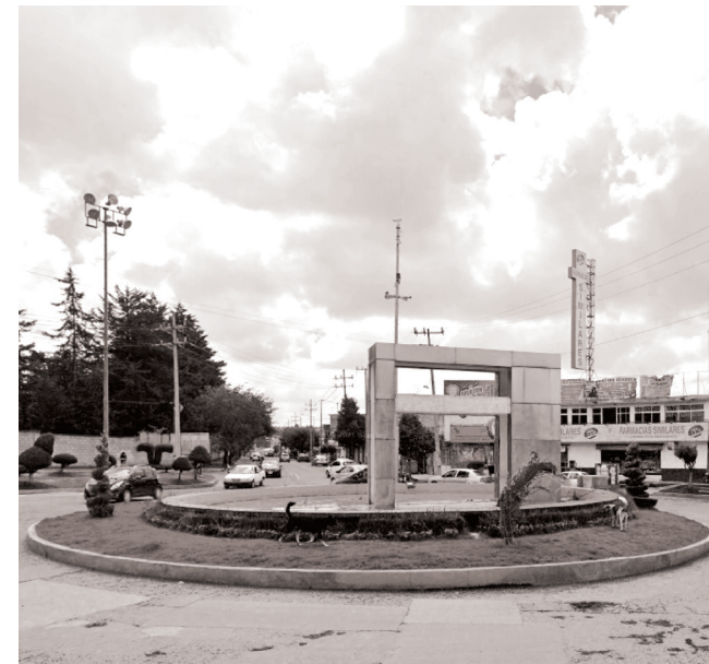
En la administración de 2009-2012 se demuele la glorieta y se construye una fuente con forma abstracta que permanece actualmente.