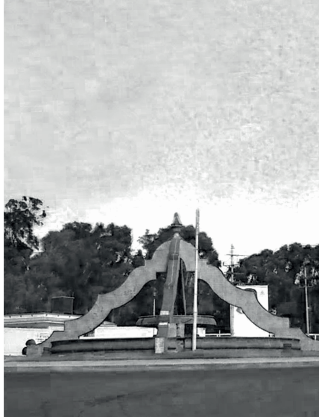
Glorieta construida entre 1990-1993