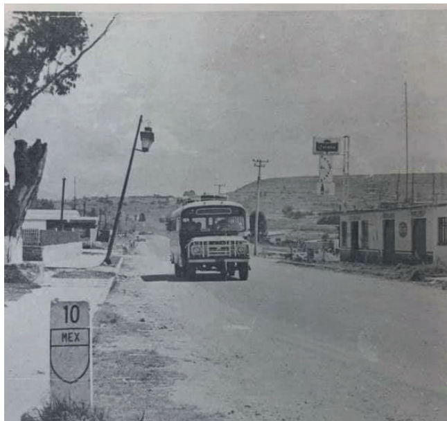
Camino hacia Almoloya en 1970, el trazo de la Av. Benito Juárez era lineal.