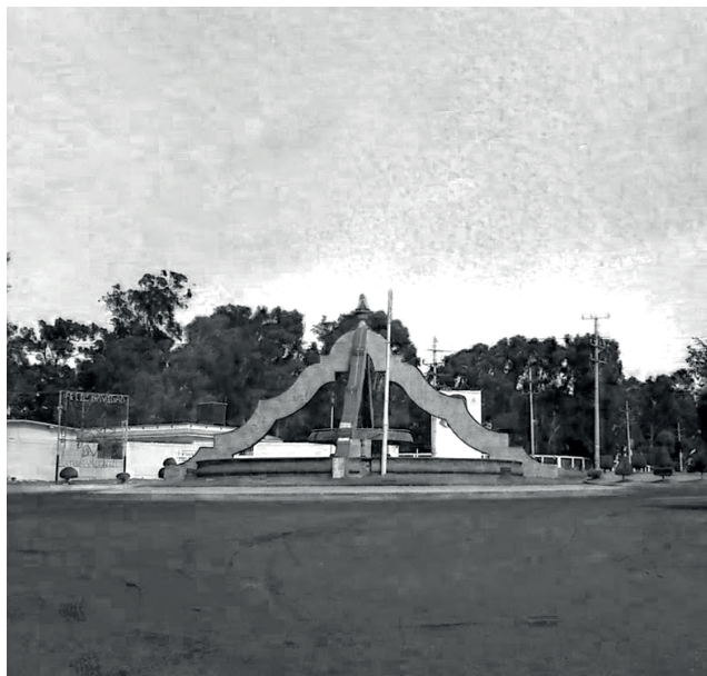
Glorieta construida a finales del siglo XX, entre los años de 1990 y 1993, su diseño se basó en los puntos cardinales, retomando elementos de talavera.